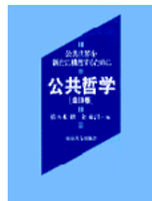
東大出版会:公共哲学

ユビキタス社会の到来で、俄かに注目されてきたのが 生体認証技術 。次第に「社会的ヒト」の領域に近づいてくるコンピュータですが、「ヒト」には不可欠の知・徳・体の3要素のうち、知力(計算機能)と体力(入出力処理機能)の異常な発達に対して徳力(最適値の自己選択機能)が殆ど発達しなかったところが大きな課題です。十分すぎるほどの知育・体育に加えて、これからどうやって「徳育」を施すのか、その教育理念が問われなければならないと思います。対処療法的なセキュリティシステムの開発は無意識な「性悪説」世界で「いたちごっこ」を繰り返すばかりかもしれません。「徳」をもつロボットというコンセプトは不可能な絵空事では無い筈ですが。